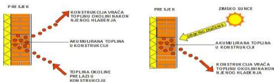
Slika 3. Akumulacija topline

Staklenik se nalazi na južnoj strani kuće. Iza njega se nalazi masivan, tamno obojen zid koji apsorbira Sunčevo zračenje. Staklo je uglavnom nepropusno za dugotrajno Sunčevo zračenje, a toplina ostaje u prostoriji. Staklenik smješten na sjevernoj strani koja nije osunčana mora obavezno biti termički izoliran.