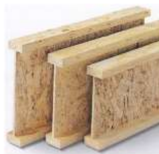
Slika 6. Drveni I nosači

Udio drveta u zidu proporcionalno je visok. Pošto drvo ima veću toplinsku provodljivost od izolacije dolazi do stvaranja toplinskih mostova u zidu koji slabe izolaciju zida, odnosno kuće. Da bi se ta činjenica smanjila koriste se drveni I nosači (slika 6) sastavljeni od gornje i donje letve od masivnog drveta dok se između nalazi ispuna od drvenog materijala (vezana ploča, OSB ploča).