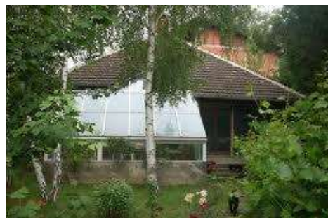
Slika 2. Zimski vrt