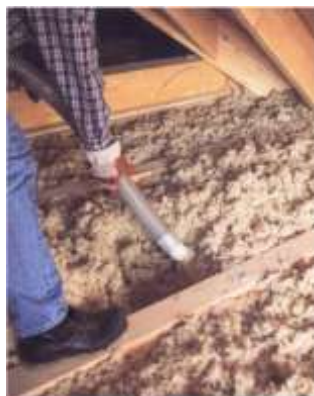
Slika 7. Upuhivanje toplinske izolacije između drvene konstrukcije pasivne kuće

Debljina toplinske izolacije zavisi od materijala i kreće se od 25 do 40 [cm], mada može biti i veća. Izbor materijala toplinske izolacije zavisi od nosive konstrukcije pasivne kuće. Kod lagane konstrukcije najčešće se primjenjuju celulozna i drvena vlakna, ovčja vuna ili konoplja. Toplinska izolacija postavlja se upuhivanjem između drvene konstrukcije (slika 7).