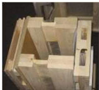
Slika 5. Model drvene zidne konstrukcije

Osnovna konstrukcija ovog tipa pasivne kuće je sistem stubova i greda koji čine drveni okvir. Debljina stubova i greda ne treba prelaziti 16 [cm] što ne može omogućiti dovoljnu toplinsku izolaciju pa se zidna konstrukcija sastavlja iz više slojeva. Sa vanjske strane dobiva se dodatni sloj toplinske izolacije a sa unutrašnje strane izvodi se instalacijski sloj koji također predstavlja jedan vid toplinske izolacije (slika 5) .