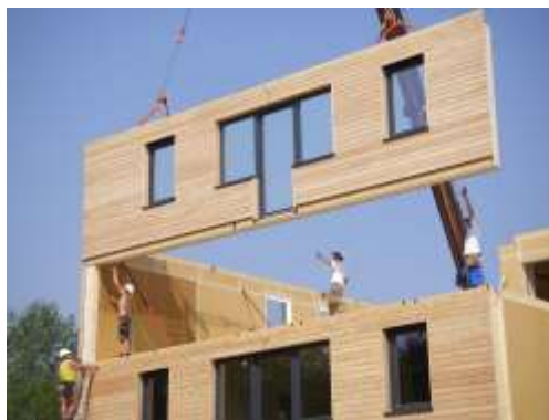
Slika 4. Drvena konstrukcija vanjskih zidova pasivne kuće

Kod konstrukcije pasivnih kuća mogu se primjenjivati različite vrste konstrukcija. Mi ćemo se u radu fokusirati na tzv. laganu konstrukciju koja podrazumjeva upotrebu drveta u vanjskim zidovima kao i odgovarajuću izolaciju. Osnovna prednost lagane konstrukcije je u tome što toplinska izolacija nije postavljena na zid već između drvene konstrukcije (slika 4) čime se smanjuje debljina zida uz isti učinak toplinske izolacije.