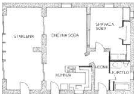
Slika 1. Tlocrtni raspored prostorija u odnosu na sjever

Pasivne solarne građevine najčešće imaju tlocrt (pogled odozgo) u obliku pravougaonika (slika 1), tako da je jedna stranica pravougaonika duža od druge.